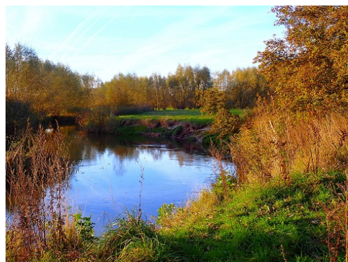
De Dommel op Vressel